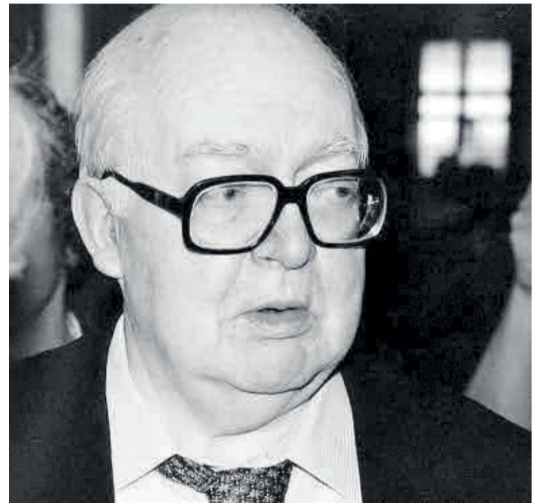
Friedrich Dürrenmatt en 1989.

LA SOSPECHA Friedrich Dürrenmatt ► Editorial: Tusquets ► Precio: 18 €