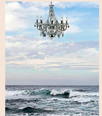
PhotoEspaña Santander reunirá fotografías de 60 autores.