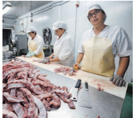
Emprega Muller es la línea de ayudas con mayor dotación.

Las ayudas directas para la contratación varían en cuantía en función del perfil de trabajador seleccionado por la empresa y pueden llegar a los 16.000 euros. La cantidad se elevará un 25 % para todas aquellas compañías con más de 50 trabajadores pertenecientes a los sectores estratégicos y con una tasa de estabilidad en sus cuadros de personal del 70 %; para las firmas que estén localizadas en concellos del rural o si las personas beneficiadas son mujeres, mayores de 45 años o emigrantes retornados.