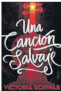
'Una canción salvaje' Puck