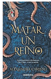
'Matar un reino' Océano Gran Travesía

NADIE DIRÍA QUE le aburre el cine porque no le ha gustado una película. Si tu hijo adolescente o preadolescente jura que no le gusta leer, seguramente no ha topado con el libro adecuado. Esta mini-guía resolverá los casos más difíciles a base de misterio, terror y mundos fantásticos. Aparcarán la tablet .