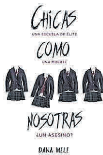
'Chicas como nosotras' Puck