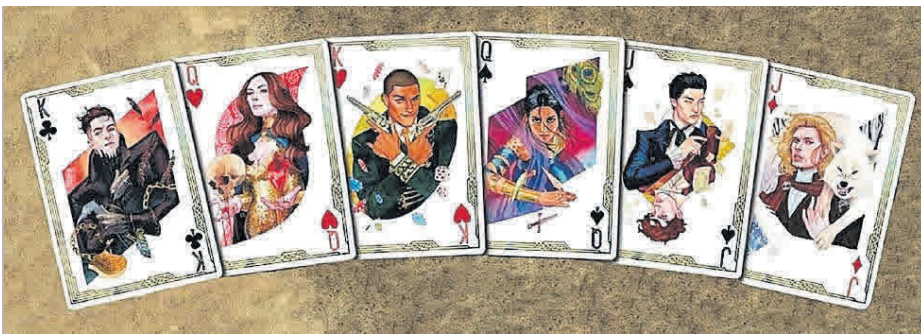
Ilustraciones de 'Seis de cuervos' (arriba) y 'Reino de ladrones' (sobre estas líneas), novelas de la exitosa saga editada por Hidra.