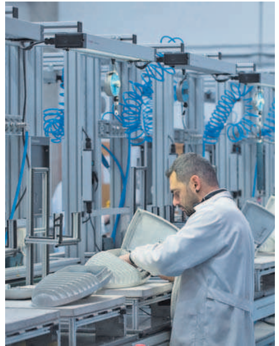
El 50 % de las ventas de la firma proceden del mercado internacional.

Moonoff sigue a pies juntillas dos lemas que conocen bien los más de cincuenta empleados de la compañía. El primero, «nacidos para iluminar el mundo», resume la filosofía de Moonoff desde el inicio de esta aventura. De hecho, solo un año después del lanzamiento de la empresa se creó la filial de Miami, «por una acción estratégica debido a los lazos comerciales y culturales de los que goza la ciudad con los países latinos», comen-