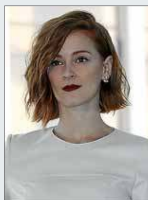
Arriba, Concha Velasco y Yon González. Sobre estas líneas, las actrices Blanca Suárez y Ana Polvorosa.