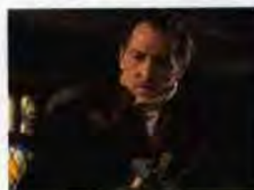
DR. VAN HELSING (Peter Cushing) en 'Drácula' (Terence Fisher, 1958).