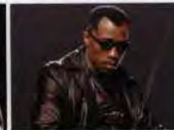
BLADE (Wesley Snipes) en 'Blade' (Stephen Norington, 1998).