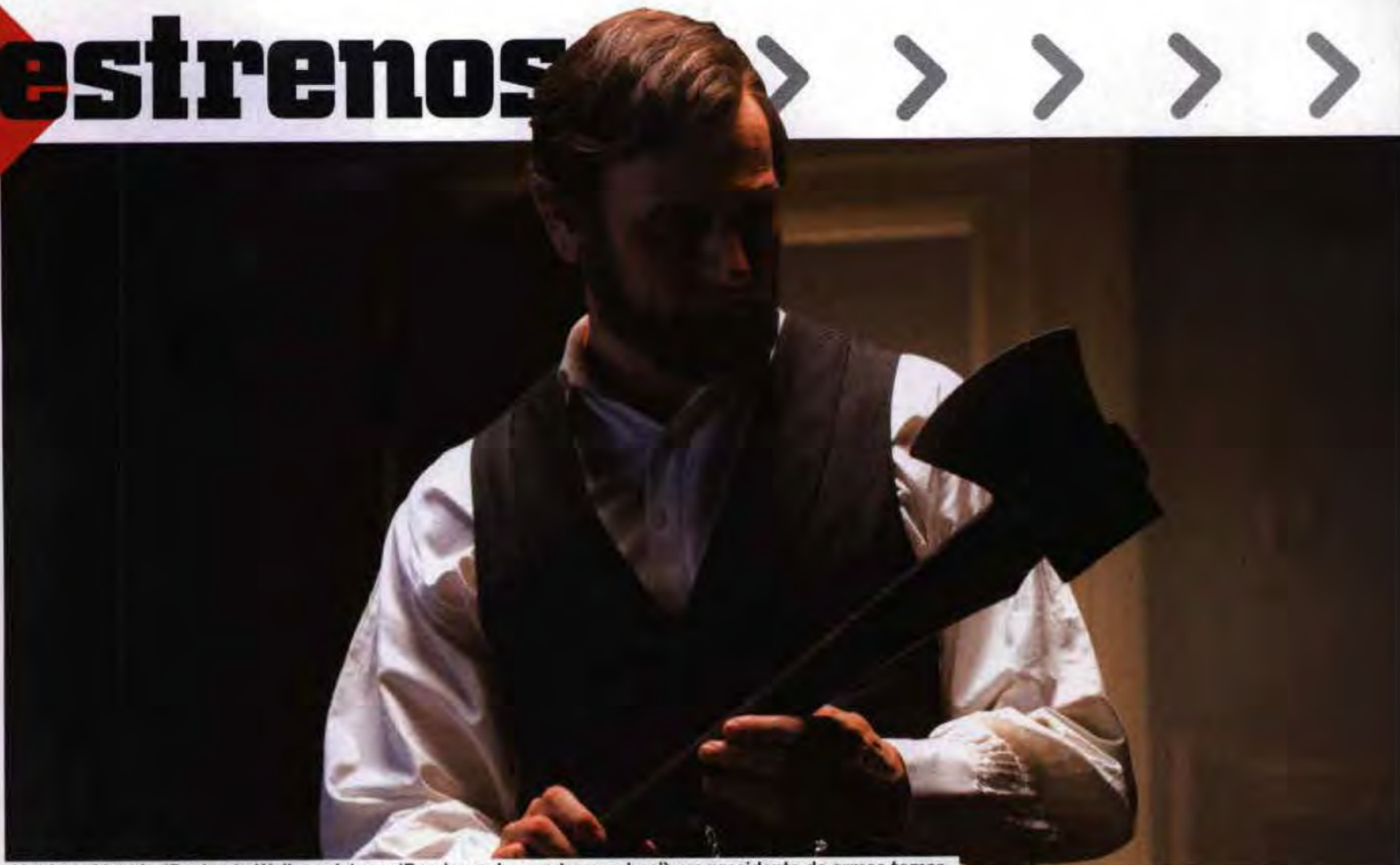
Abraham Lincoln (Benjamin Walker, visto en 'Banderas de nuestros padres'), un presidente de armas tomar.