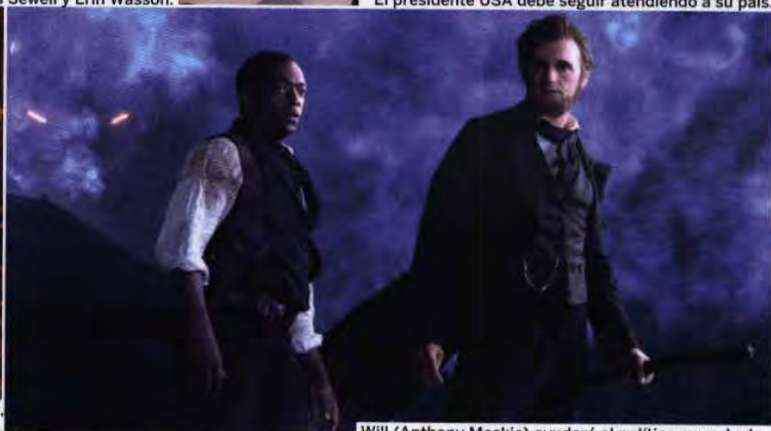
Will (Anthony Mackie) ayudará al político en su lucha.

Benjamin Walker, al que los responsables del film descubrieron tras verle sobre las tablas. El riesgo de interpretar a un icono es impedir que sea humano , razona el actor (visto en Banderas de nuestros padres ); hay que aceptar que sea vulnerable o estúpido . Afortunadamente, Tim (Burton) y Timur (Bekmambetov) estaban abiertos a permitir que Abraham fuera un hombre imperfecto, conflictivo y hasta gracioso. Burton le da la razón: El personaje tiene que tener sentido del humor, porque nadie podría sobrevivir sin él siendo cazador de vampiros .