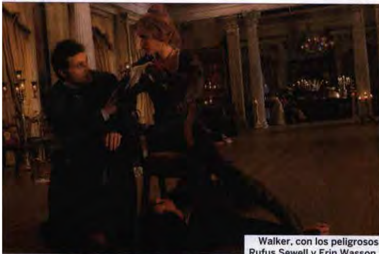
Walker, con los peligrosos Rufus Sewell y Erin Wasson.