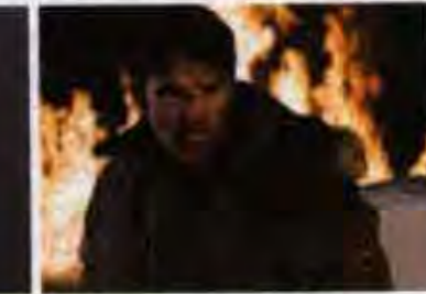
EBEN OLESON (Josh Hartnett) en '30 días de oscuridad' (David Slade, 2007).