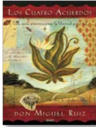
Los cuatro acuerdos (Don Miguel Ruiz)