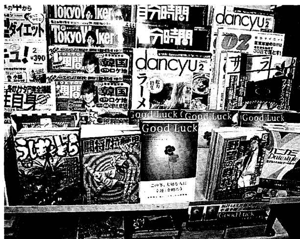
Edición japonesa del libro 'La buena suerte', que aparece rodeado de mangas en un quiosco de Tokio.

De 'La buena suerte, claves de la prosperidad' han sido editados más de tres millones de ejemplares en todo el mundo y ha sido traducido a 37 lenguas.