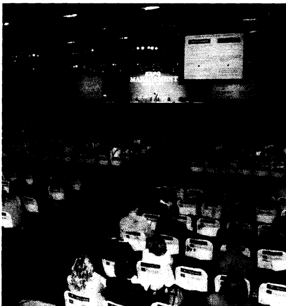
Los organizadores esperan la asistencia de más de 25.000 directivos