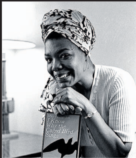
Maya Angelou . | LP/DLP