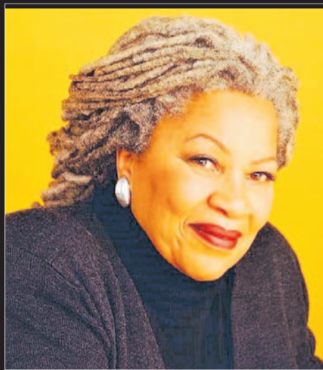
Toni Morrison.