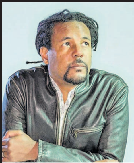
Colson Whitehead . | LP/DLP

El monstruo ya está creado y, con el salto a los casinos de Atlantic City, quedará liberado del control directo de su padre. Es ahí cuando arranca la historia de inversiones ruinosas, de pésimas gestiones y de bancarrotas que le convierten en un rehén de los bancos, en un nombre franquiciado y en una estrella de reality show . En 2016, gana las presidenciales. Y al llevar a la Casa Blanca a ese hombre cuyo aprendizaje de la vida es que no importa lo que haga -porque él siempre saldrá adelante-, EE UU decide internarse en el abismo. Por la escueta rana de las urnas.