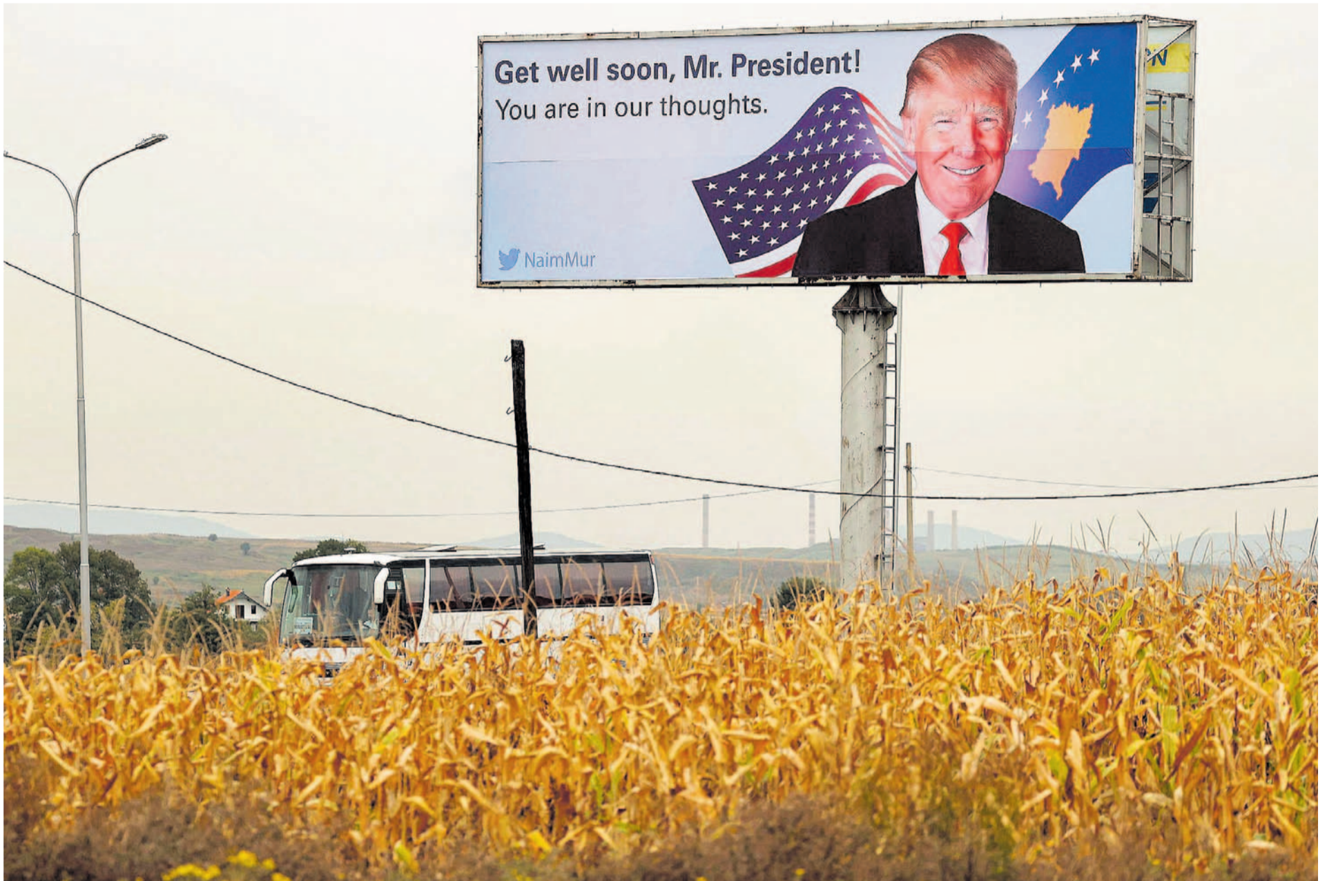
Campana electoral de Donald Trump a la presidencia de los EEUU.