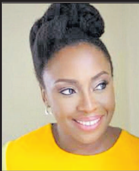
Chimanda Ngozi Adichie.