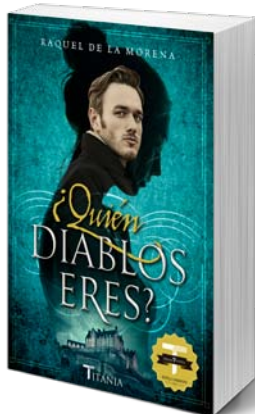
Titania 22 €