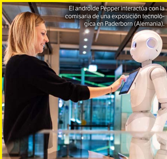
El androide Pepper interactúa con la comisaria de una exposición tecnológica en Paderborn (Alemania).