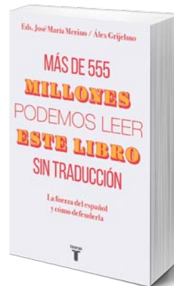
Taurus 22,90 €