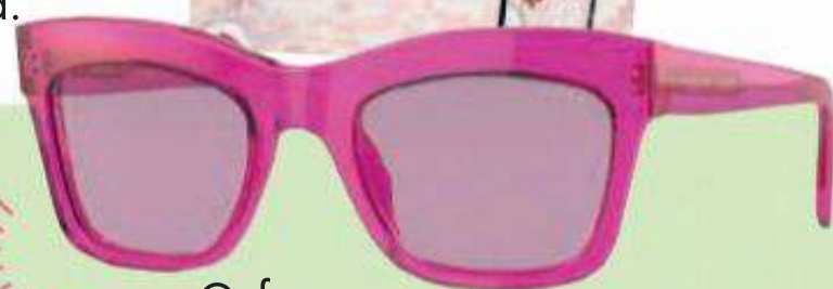
Gafas rosas, Vogue Eyewear (99 €).