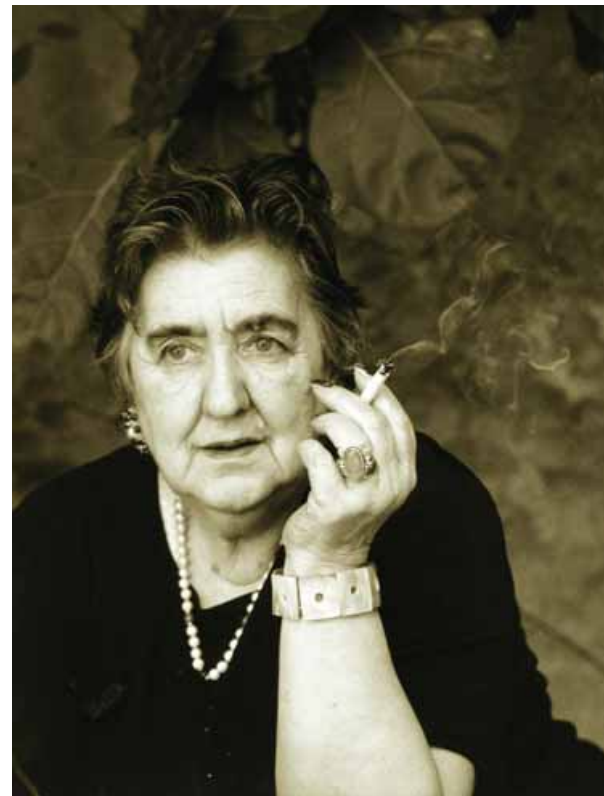
La poeta italiana Alda Merini.

ALDA MERINI Mármara Ediciones 140 páginas