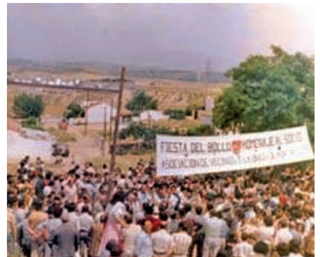
HORTALEZA EN IMÁGENES: El rehabilitado Silo de Hortaleza ofrece, en su primera exposición, un recorrido en 84 imágenes para mostrar al público cómo eran en el siglo pasado barrios como Canillas, Villa Rosa o Las Cárcavas-San Antonio. También aborda los nuevos desarrollos urbanísticos de Sanchinarro y Valdebebas.

MADRID >> Tabacalera. La Principal | A partir del 23 de noviembre | Gratuita