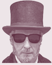
Marqués de Gurugú