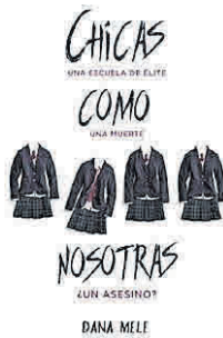
'Chicas como nosotras' Puck