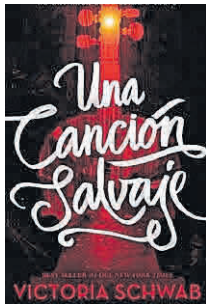
'Una canción salvaje' Puck