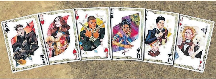
Ilustraciones de 'Seis de cuervos' (arriba) y 'Reino de ladrones' (sobre estas líneas), novelas de la exitosa saga editada por Hidra.