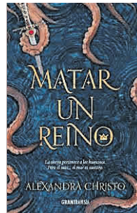
'Matar un reino' Océano Gran Travesía

NADIE DIRÍA QUE le aburre el cine porque no le ha gustado una película. Si tu hijo adolescente o preadolescente jura que no le gusta leer, seguramente no ha topado con el libro adecuado. Esta mini-guía resolverá los casos más difíciles a base de misterio, terror y mundos fantásticos. Aparcarán la tablet .