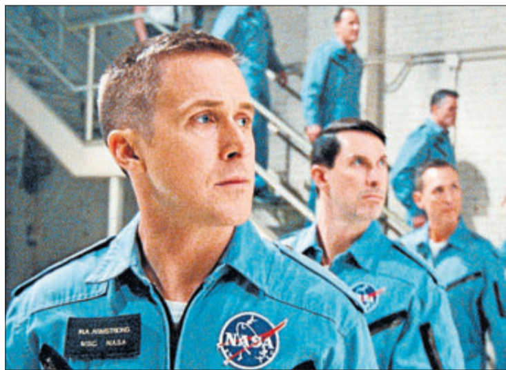
Ryan Gosling, en la película First Man .

Además de Dench, este otoño nos devuelve a otras grandes del cine: Emma Thompson, en La ley del menor , sobre la novela de Ian McEwan del mismo título; Glenn Close La buena esposa , que tam-