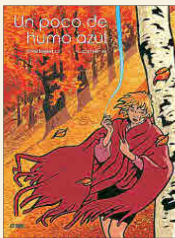
Denis Lapière y Rubén Pellejero Un poco de humo azul ASTIBERRI, 2018

❖ Inspirándose en el libro de relatos de Ricard Ruiz Garzón Las voces del laberinto (2005), el joven Alfredo Borés debuta en esta novela gráfica que se sumerge en el oscuro mundo de las enfermedades mentales, especialmente en el de la esquizofrenia. Cinco relatos que dan voz a aquellos que, sin dejar de ser ellos mismos, conviven con otras presencias dentro de su mente. Una obra magnífica que trata soberbiamente un duro tema.