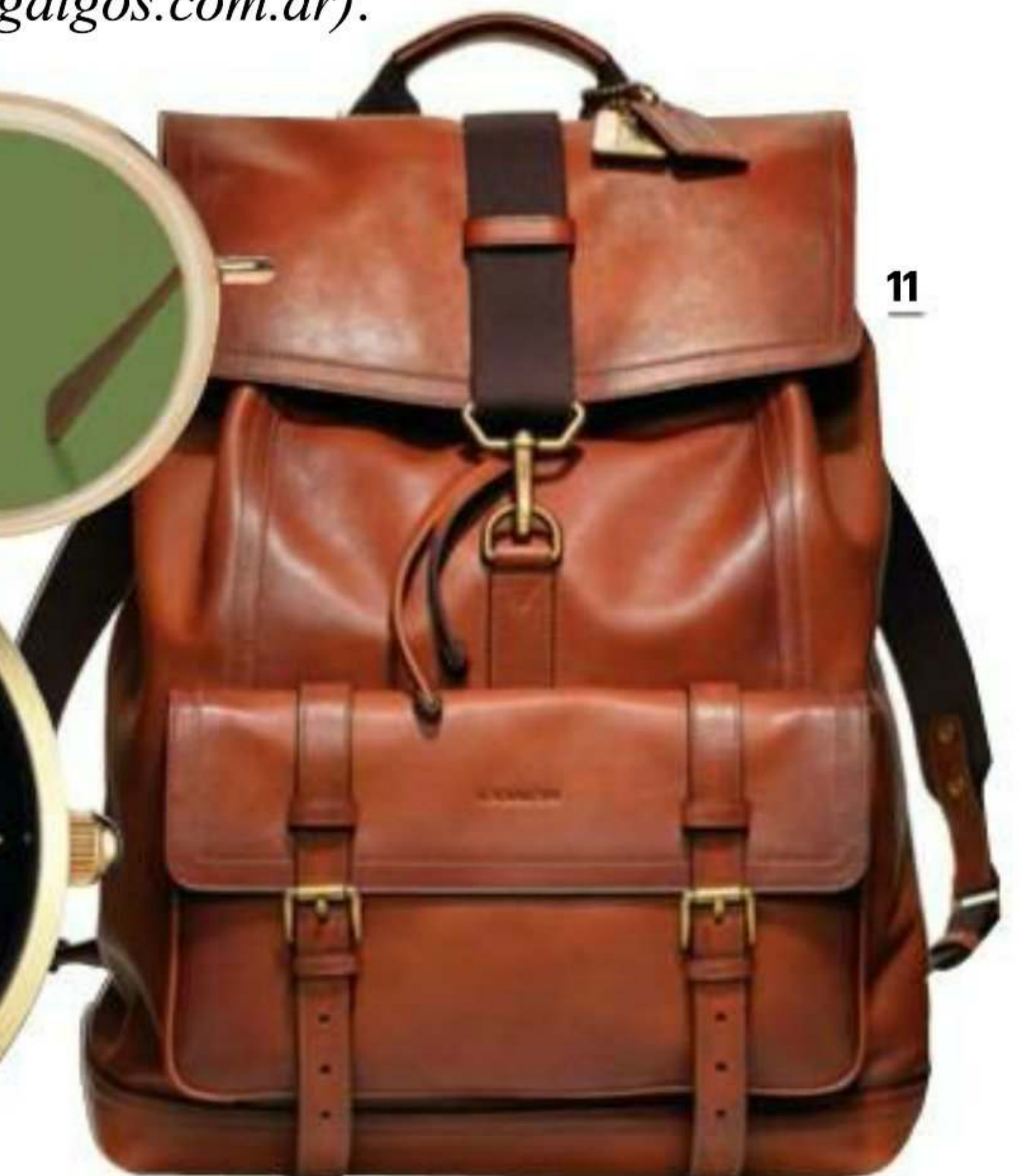
1. Libro Jane Austen en la intimidad de Lucy Worsley (Indicios, 24€). 2. Butaca Ox de Jogersen de Batavia (c.p.v.). 3. Pin de Hook & Albert (25€). 4. Ginebra Gin MG (c.p.v.). 5. Jersey de Kenzo (475€). 6. Habitación del hotel Rooney's. 7. Mule de Men's Publish x The North Face (60€). 8. Pepinillos de Petra Mora (1,68€). 9. Gafas Kowalski de Kaleos (250€). 10. Reloj de Rosefield (99€). 11. Mochila Bleecker de Coach (585€).