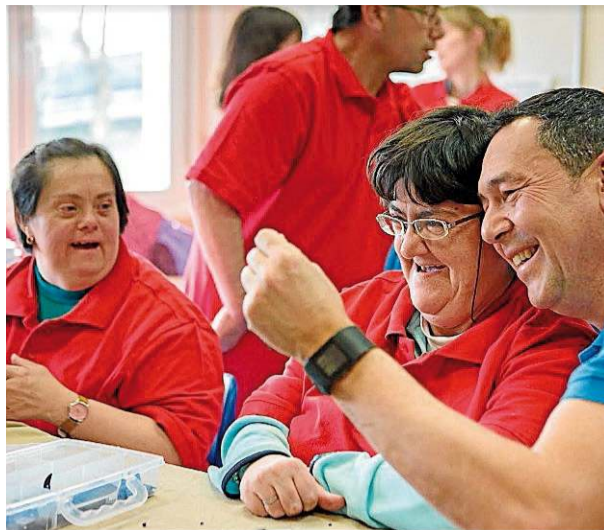
SOLIDARIDAD Plano de un taller de 'la Caixa'.

Ayudas a Proyectos de Iniciativas Sociales: promoción de la autonomía personal y atención al envejecimiento, a la discapacidad y a la enfermedad; lucha contra la pobreza infantil y la exclusión social; viviendas para la inclusión social; inserción sociolaboral; interculturalidad y acción social; y acción social en el ámbito rural. En el conjunto de España, la inversión alcanzó los 19,7 millones de euros. ECG