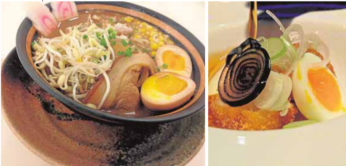
Clásico ramen japonés (izquierda) y ramen de bigotes de bagre de Sollo (derecha).

Fiel al original o en versiones de fusión, la sopa japonesa más completa causa furor en España