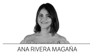
ANA RIVERA MAGAÑA

Verde también es el tercer libro de Carla Zaplana, dietista, nutricionista y mentora de salud especializada en alimentación vegetal. Si en el primero nos daba a conocer las bondades de los 'superfoods' y en el segundo mostraba los beneficios de los zumos verdes, en este se centra en los batidos. El punto en común en