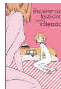
Kabi Nagata Mi experiencia lesbiana con la soledad FANDOGAMIA, 2018

A pesar de la complejidad del tema, Mi experiencia lesbiana con la soledad es un manga ameno que consigue, con su estilo