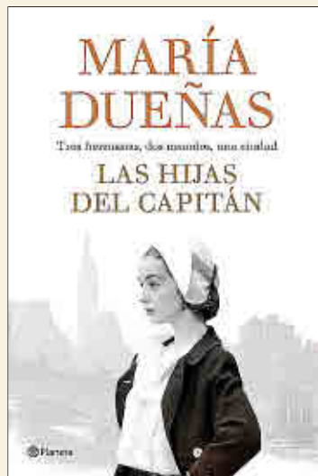
María Dueñas Las hijas del capitán PLANETA. Barcelona, 2018

♦ María Dueñas llegó en 2009 con su éxito incontestable El tiempo entre costuras y desde entonces se ha convertido en una de las autoras más esperadas en los países de habla hispana. Las hijas del Capitán es su cuarta novela y cuenta las peripecias de las temperamentales Victoria, Mona y Luz Arenas, que se ven obligadas a seguir en el negocio familiar -españoles emigrados a Nueva York en 1936- tras la muerte del padre.