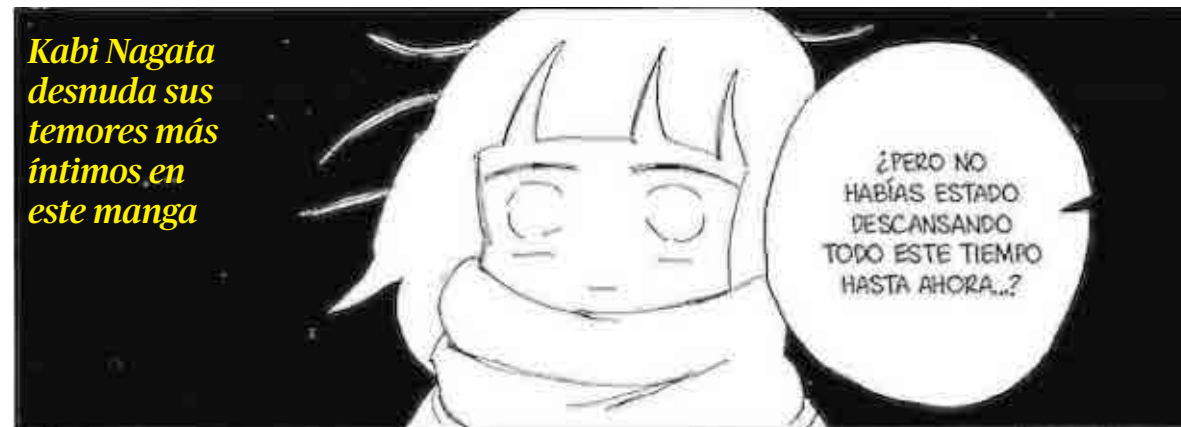
Kabi Nagata desnuda sus temores más íntimos en este manga

Cuando alguien se ve sacudido por estas tormentas, cualquier pequeña victoria es representativa, pero también cualquier zozobra en el proceso puede hundirlo. Dentro de la complejidad de todo el camino por el que pasa la autora, ella misma se da cuenta de que una de las