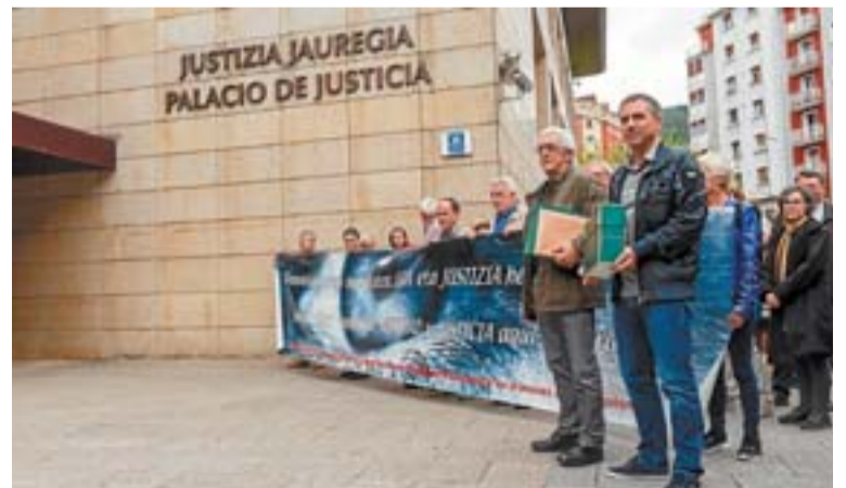
Ayuntamiento y Plataforma de Víctimas, en el juzgado.

La querrela recoge cincuenta testimonios orales. Entre 1960 y 1978 otros 700 eibarreses fueron represaliados. No en vano, en la querrela que se formaliza en Eibar se personarán una serie de denunciados, entre los cuales hay algunas víctimas de torturas por parte de la Guardia Civil y la Policía Nacional, también casos de asesinados