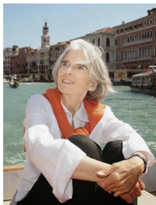
La escritora Donna Leon.

La novela comienza con el comisario Guido Brunetti perdiendo el conocimiento en medio de un interrogatorio. Tanto el médico como su esposa Paola coinciden en que se ha de tomar unas vacaciones lejos del bullicio de Venecia y del agobio de su comisaría. Es-