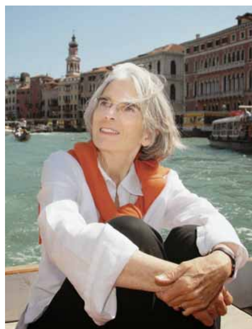
La escritora Donna Leon.

La novela comienza con el comisario Guido Brunetti perdiendo el conocimiento en medio de un interrogatorio. Tanto el médico como su esposa Paola coinciden en que se ha de tomar unas vacaciones lejos del bullicio de Venecia y del agobio de su comisaría. Es-