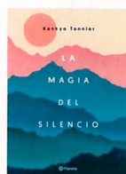
LA MAGIA DEL SILENCIO Kankyo Tannier Planeta

Todos nos enfrentamos a la tristeza en un momento u otro de la vida: forma parte de la experiencia humana. A menudo se trata de una situación pasajera, pero en ocasiones nos embarga un dolor tan profundo que apenas somos capaces de seguir adelante. Es entonces cuando debemos contemplar el malestar y el sufrimiento bajo una perspectiva espiritual. Es entonces cuando se abre la posibilidad de despertar. Las lágrimas están ahí para señalarnos aspectos de nosotros mismos que precisan ser transformados.