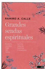
GRANDES SENDAS ESPIRITUALES Ramiro Calle Booket

Gerónimo Stilton es un tipo un poco distraído, con la cabeza en las nubes. Dirige un periódico pero su verdadera pasión es escribir. En Ratonía, la Isla de los ratones, todos sus libros son Best Sellers.