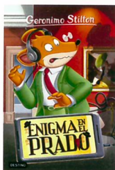
ENIGMA EN EL PRADO Geronimo Stilton Planeta de libros

Alguien ha robado un famosísimo cuadro en el Museo del Prado... ¡Y resulta que, por una extraña coincidencia, estoy precisamente aquí, en Madrid, con mi amigo el detective Metomentodo! ¡Así es como comienza esta nueva aventura superrratónica!