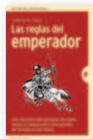
Las reglas del emperador Edita: Empresa Activa (2017) 192 páginas; 14 euros