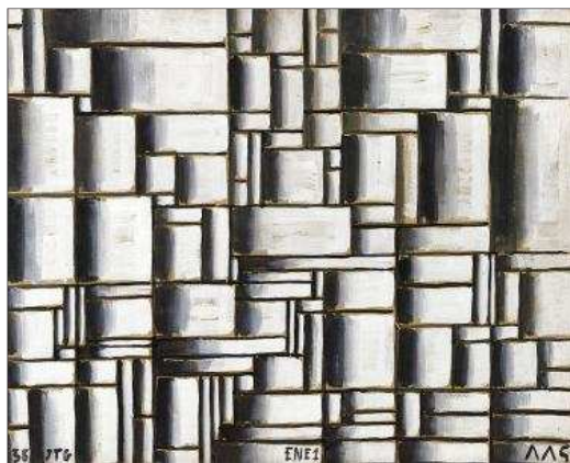
'Construcción en blanco y negro' (1938).

«Torres-García trató de ser todo lo que se puede ser en Nueva York: artista de vanguardia, se interesó por Broadway y por la publicidad,