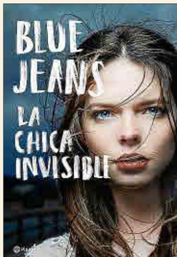
Blue Jeans La chica invisible PLANETA. Barcelona, 2018

♦ Aurora Ríos es invisible para casi todos. Su pasado ha hecho que se aisle del mundo y que apenas se relacione. A sus 17 años, no tiene amigos y está harta de que los habitantes de aquel pueblo hablen a su espalda. Una noche de mayo, su madre no la encuentra en casa cuando regresa del trabajo. Aurora aparece muerta a la mañana siguiente en el vestuario de su instituto. Julia Plaza, compañera de clase de la chica invisible, está obsesionada con encontrar la respuesta.