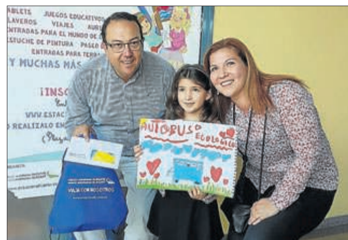
Premiados en el concurso infantil de pintura «Viaja con nosotros», organizado por la Estación de Autobuses de Alicante.

■ Seis niños han resultado ganadores en las diferentes categorías del Concurso de Pintura «Viaja con nosotros», organizado por la Estación de Autobuses de Alicante. Las votaciones se han realizado en la categoría popular a través de los «Me gusta» de Facebook y las papeletas de la urna habili-