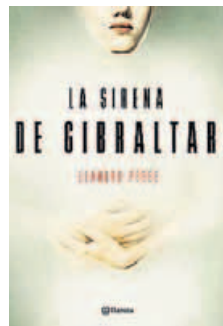
La sirena de Gibraltar