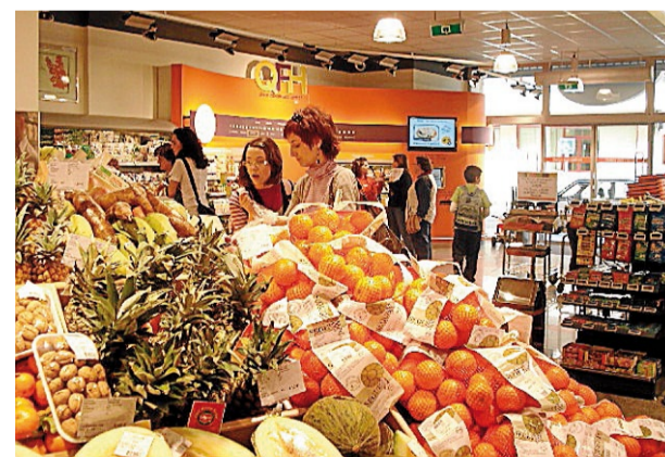
Frunatur programa visitas para escolares

Una de las zonas que más les sorprenden, y que en general contemplan con cierto asombro y expectación, son las grandes cámaras frigoríficas que conservan la mercancía a la temperatura y humedad idónea, en las que tienen la opción de introducirse unos instantes para comprobar las sensaciones. REDACCIÓN