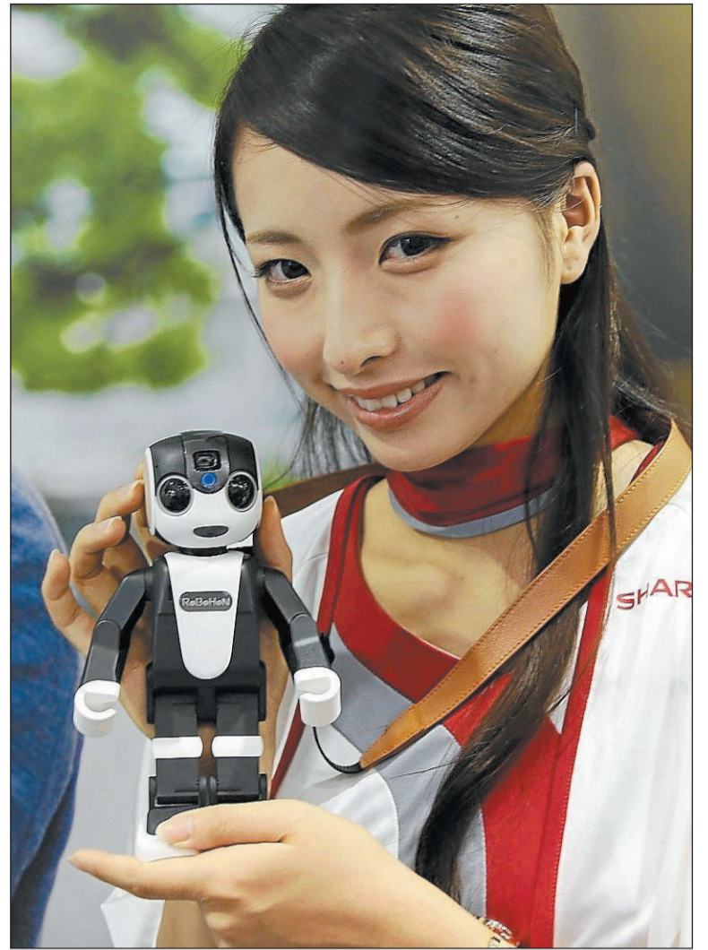
Una modelo muestra el robot RoboHon, de Sharp, en la feria de tecnología y electrónica CEATEC Japan 2015, en Tokio.

Esto también se ve en el gremio de la robótica, que trabaja para lograr creaciones que cada vez se adapten mejor al día a día de cualquier persona. El último en mover pieza ha sido Sharp, que ha creado 'RoboHon', un cruce entre robot y 'smartpho-