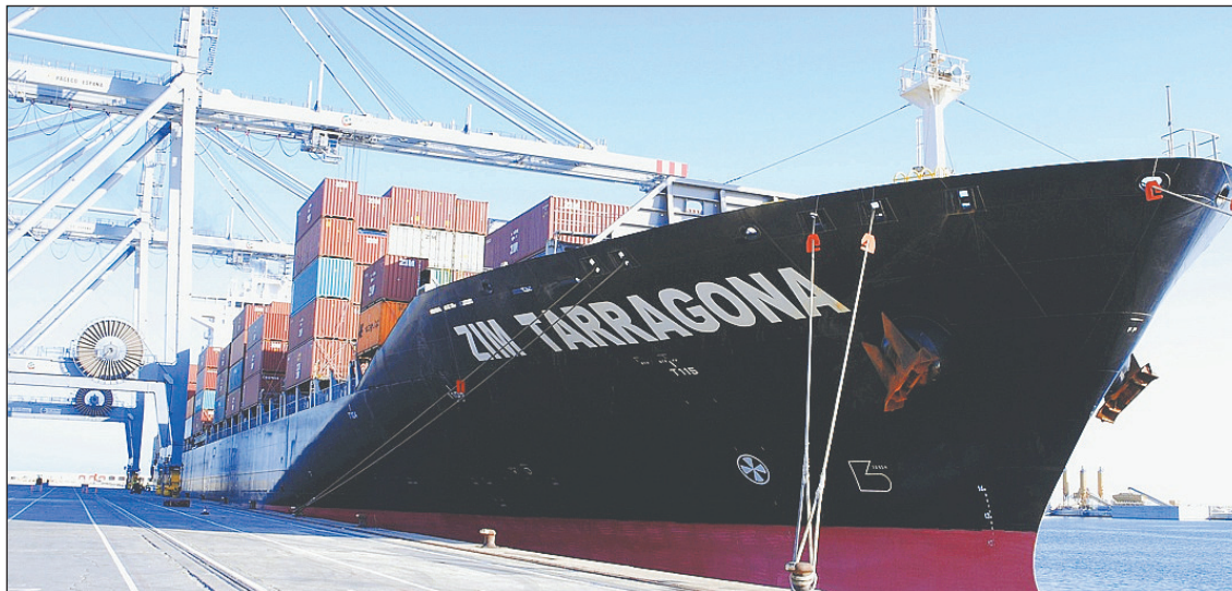
La compañía une también Tarragona con Israel.

La naviera israelí ZIM trabaja en el Port de Tarragona