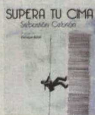
Supera tu cima Autor: Sebastián Cebrían Editorial: Lid Editorial Precio: 19,90 euros

En momentos como los actuales, Cebrían hace hincapié en la capacidad de adaptación y de aprendizaje. Las mejoras sólo llegarán si somos receptivos al entorno y nos atrevemos a hacer cosas nuevas. También insiste en acercarse a la dimensión real del problema para que las decisiones se adecuen a las verdaderas necesidades.