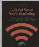
Guía del social media marketing Autor: H. Zunzarren y B. Gorospe Precio: 15,38 euros

¿Conoce la oferta de herramientas online existentes y su utilidad? Una amplia mayoría responderá que no. Por eso Hugo Zunzarren y Bértol Gorospe han reunido en su obra los últimos avances y aplicaciones de los medios digitales. En concreto se centran en los social media , que consideran una herramienta empresarial básica. A través de un sencillo recorrido aportan una visión del entorno online, sus ventajas y desventajas, las precauciones que se deben tomar, a la vez que dan las pautas para desarrollar una estrategia propia.