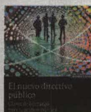
El nuevo directivo público Autor: Antonio Núñez Editorial: Eunsa Precio: 18 euros

La Administración Pública necesita una reforma. Ahora más que nunca está cuestionada su forma de trabajar y ha llegado el momento de realizar los cambios necesarios. La tesis del libro de Antonio Núñez trata de resolver dos cuestiones aparentemente sencillas: si la función directiva pública es diferente de la privada; y si es así, determinar cuáles son las habilidades que deben reunir estos jefes y trasladarlas a los programas de formación. El