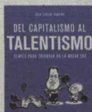
Del capitalismo al talentismo Autor: J.C. Cubeiro Editorial: Deusto Precio: 18,95 euros

En el plano económico el autor dice que hay mirar más hacia el bien común y potenciar nuevas competencias laborales y profesionales.