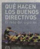
Qué hacen los buenos directivos Autor: Llopis y Ricart Editorial: Pearson Precio: 18,95 euros

ñía vive un momento distinto, hay valores y modelos de actuación comunes a todos. Por ejemplo, la autoexigencia, la honestidad, la gestión de conflictos o que todos los directivos tienen el compromiso de enseñar y motivar a sus empleados para alcanzar sus objetivos.