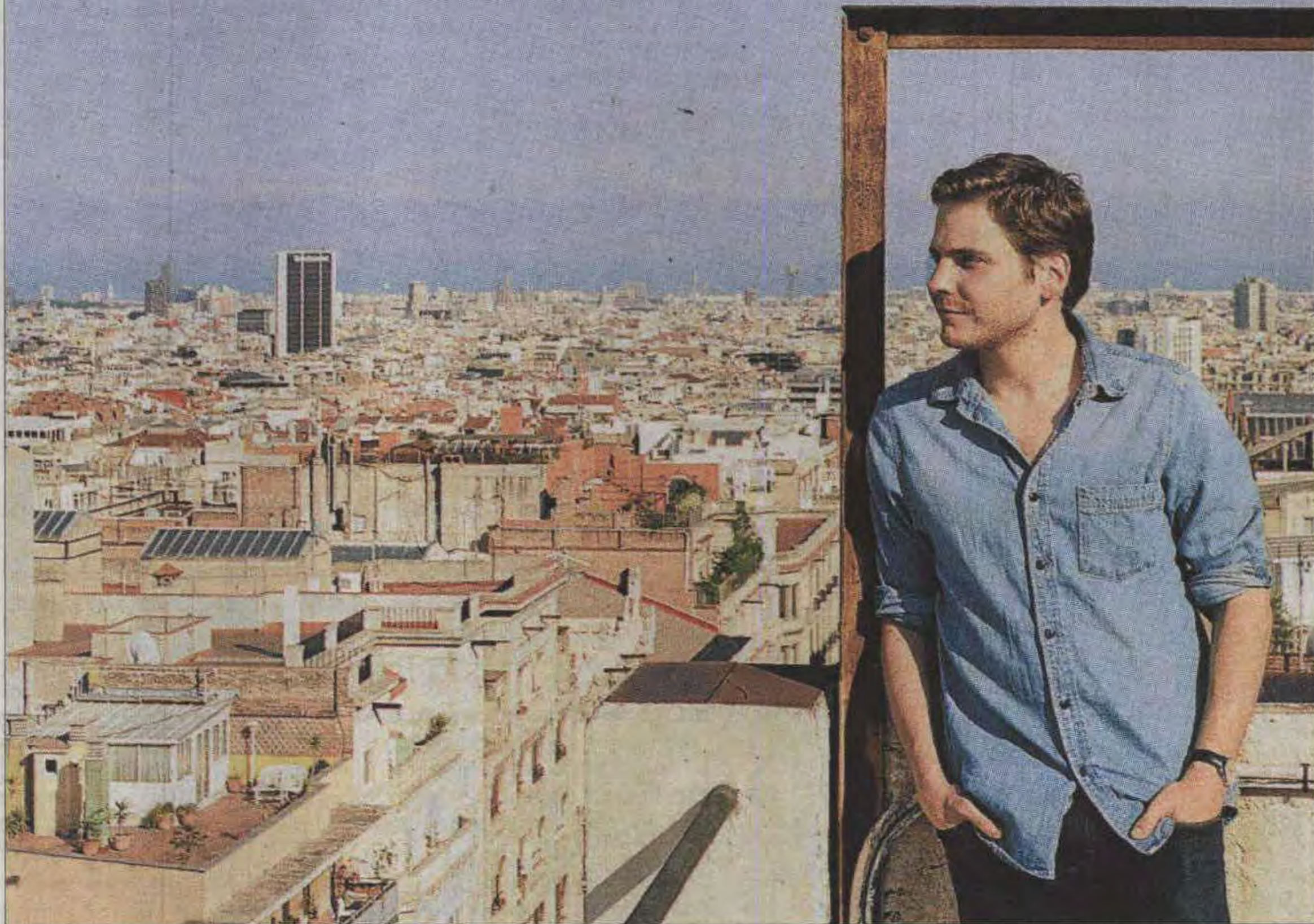
Daniel Brühl, un barcelonés medio alemán, en una foto tomada en la parte alta de la capital catalana

El protagonista de 'Good bye, Lenin!' y 'Salvador' escribe un libro s