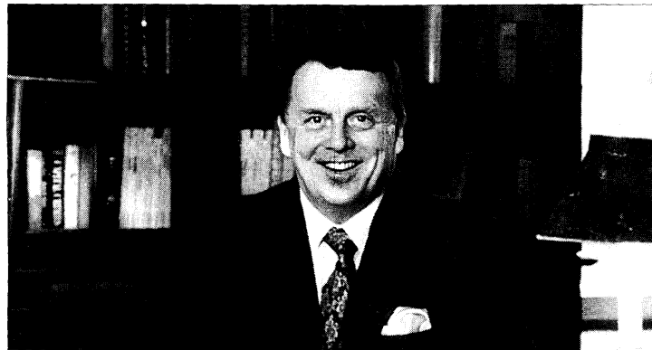
El escritor Spencer Johnson, en su despacho.

-¿Este éxito ha cambiado su vida? -Sí y no. Sí, en el sentido de que me ha dado más energía, ya que es muy bueno ayudar a gente que no conozco. Y no, por algo que tengo claro. He visto demasiadas vidas de personas con éxito deterioradas. Por eso, es importante determinar qué tiene que cambiar y qué no. Si no conservas los pies en el suelo, puedes perder tus valores. Es uno de los motivos por los que no me pongo mi foto en los libros y no me he vuelto famoso.