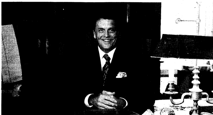
El escritor Spencer Johnson, en su despacho.

-Sí y no. Sí, en el sentido de que me ha dado más energía, ya que es muy bueno ayudar a gente que no conozco. Y no, por algo que tengo claro. He visto demasiadas vidas de personas con éxito deterioradas. Por eso, es importante determinar qué tiene que cambiar y qué no. Si no conservas los pies