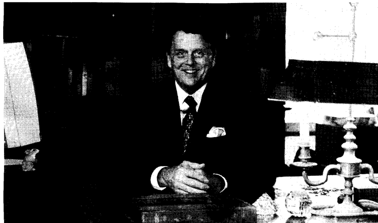
El escritor Spencer Johnson, en su despacho.

- ¿Este éxito ha cambiado su vida? - Sí y no. Sí, en el sentido de que me ha dado más energía, ya que es muy bueno ayudar a gente que no conozco. Y no, por algo que tengo claro. He visto demasiadas vidas de personas con éxito deterioradas. Por eso es importante determinar qué tiene que cambiar y qué no. Si no conservas los pies en el suelo, puedes perder tus valores. Es uno de los motivos por los que no pongo mi foto en los libros y no me he vuelto famoso. La fama es