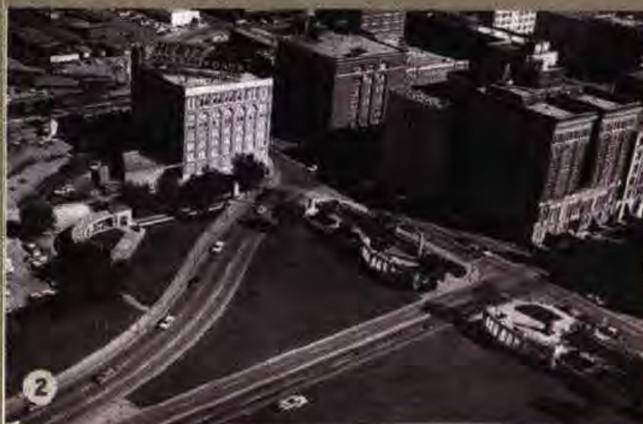
1. John Fitzgerald Kennedy y Richard Nixon antes de dar inicio a su célebre debate televisivo. 2. Vista aérea de Elm Street a su paso por Dealey Plaza, el lugar donde cayó asesinado JFK.

Kennedy? ¿Y por qué se produjo el magnicidio?