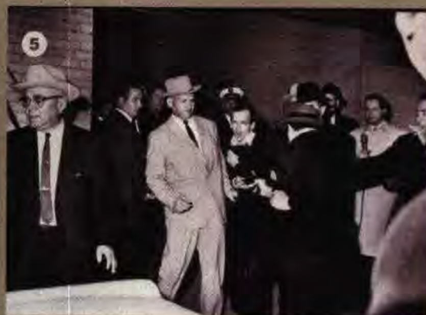
1. JFK bromea con Frank Sinatra, enlace entre el presidente y el mafioso Sam Giancana. 2. Cena de mafiosos en un restaurante neoyorquino que incluye a Carlos Marcello y Santo Trafficante. 3. Giancana, el hombre que dio la presidencia a Kennedy. 4. El presidente se dirige hacia su muerte el 22 de noviembre de 1963. 5. Momento en que Lee Harvey Oswald es asesinado por Jack Ruby.