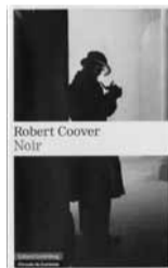
NOIR Autor: Robert Coover. Editorial: Galaxia Gutenberg. 146 páginas. Precio: 18 euros.

T omemos todos los ingredientes de la novela negra clásica, léase: un detective privado alcoholizado, cínico y solitario -Philip M. Noir, nombre, inicial y apellido que son, en sí mismos, toda una declaración de intenciones-; una viuda misteriosa y seductora -'femme fatale' en toda regla, incluyendo el velo negro que oculta oportunamente su rostro-, quien le contrata para descubrir si el finado por el que lleva luto ha sido asesinado, contraviniendo el dictamen policial indicador de que el marido se metamorfoseó en cadáver por voluntad propia; un inspector de policía, enemigo declarado y beligerante del detective Noir -el citado inspector de apellido Blue, al principio uno se creería en la Trilogía de Nueva York de Auster, pero no-; la cantante de un 'night club' frecuentados por la mafia -ambos son asiduamente frecuentados por la Organización, Flame es el nombre de la chica, Loui's el del local-; un so-