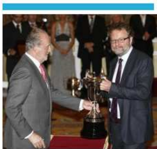
Carlin, con el Rey de España. Pablo García

Rafa se plantea ganar todos los torneos que disputa porque es una persona tremendamente ambiciosa que en todo momento piensa en cómo superarse a sí mismo y mejorar para alcanzar un nivel más a pesar de todo lo que ha ganado hasta ahora. Estoy seguro de que le encantaría ganar la Copa Masters, pero no creo que tenga la colosal importancia que tuvo en día ganar Wimbledon. Pienso que es el momento más glorioso de su carrera.