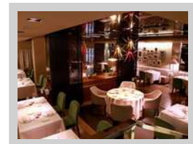
Arzak en Madrid

VOGUE Who's on next The Vogue Fashion Fund