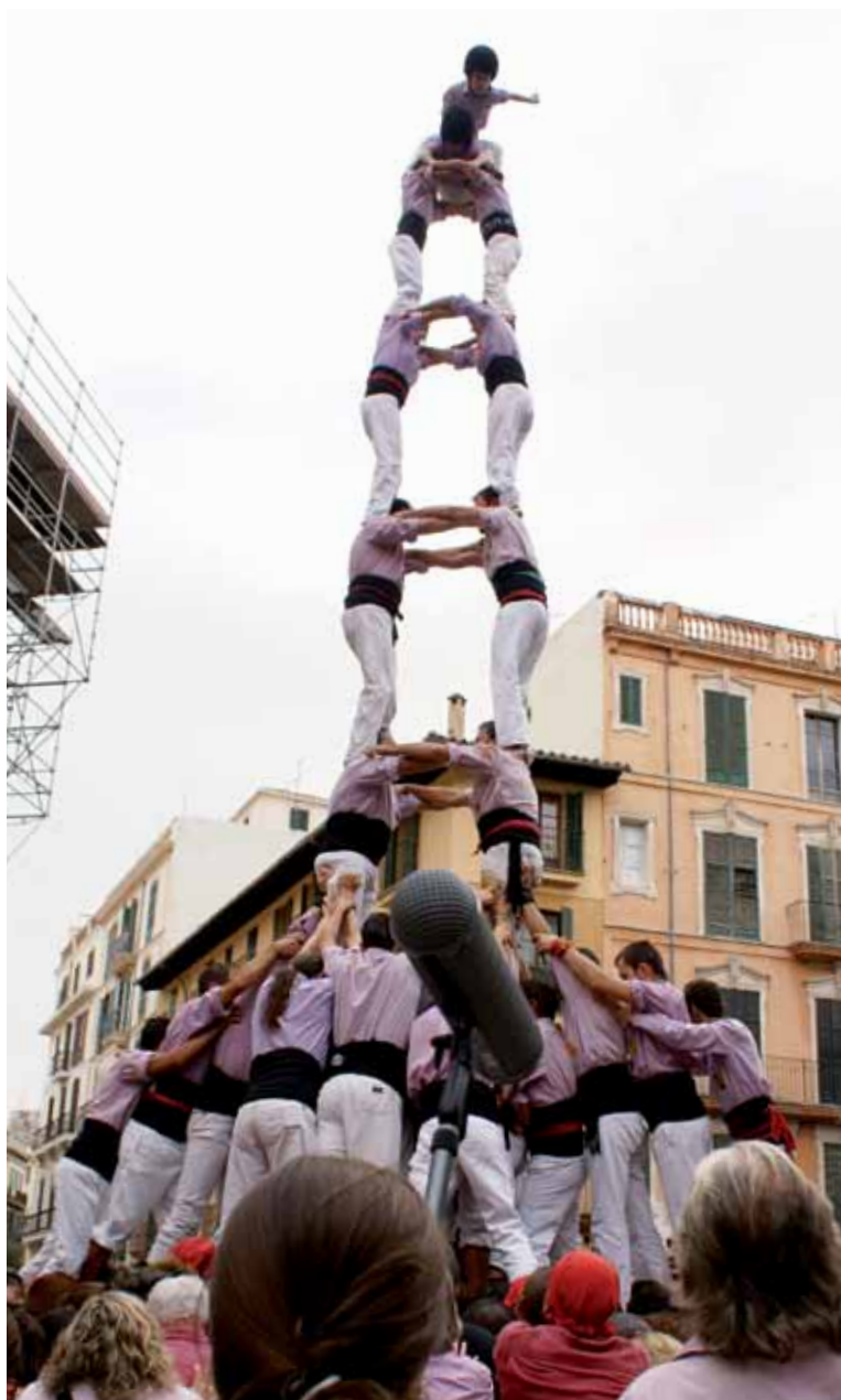
Torre de 8 amb folre dels Minyons el passat octubre, a la plaça de la Cort F. Arxiu MdT

l'entorn inigualable de poder fer castells al pati interior del Castell de Bellver. Castell de planta rodona, construït al 1310, que custodia la ciutat des del costat oest de la badia i dalt d'un turó a 100 metres per damunt del nivell de la mar. En aquesta plaça hi van descarregar el seu primer castell de 7, el 4de7 l'any 2000 i un any més tard el primer 3de7. Per tancar l'any celebren la seva Diada, actuació on també participen els Al·lots de Llevant i altra colla catalana. La realitzen el primer o segon dissabte d'octubre i representa la seva festa més gran per a la colla. Allà fan un petit cercavila que recorre diverses places, des de la trobada de les tres colles a la plaça d'Espanya fins l'entrada a la plaça de Cort, la plaça de l'Ajuntament on té lloc l'actuació. La plaça de Cort ha vist, sens dubte els millors castells: el primer pde5 (1999), el primer 4de7a (2000), el primer 5de7 (2001), el primer 3de7 per sota (2003), primer 2de7 (2005) a més de la millor actuació d'una colla de fora, amb el 3de9, el 2de8f i el 5de8 dels Minyons de Terrassa l'any 2004. Tot i els seus 15 anys, són molt conscient del llarg camí que els queda per recórrer, però una cosa sí que es pot assegurar, si algú es pensa que no hi ha fet casteller (ni festa castellera) més enllà del Principat, a les illes hi ha una realitat consolidada.