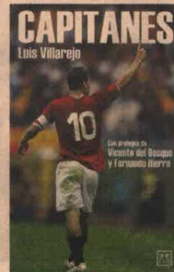
Título: Capitanes Autor: Luis Villarejo Páginas: 256 Editorial: Lid

crear equipo, de amoldar personalidades y de sacar el máximo partido a la diversidad del vestuario para hacer un grupo más creativo y competitivo. Asimismo, defiende la figura del líder como guía y aglutinador del conjunto. "El líder único no funciona, fomenta la envidia, la discrepancia y alimenta los egos del vestuario". La obra recoge múltiples testimonios de jugadores y entrenadores. Entre ellos destaca la reflexión de Radomir Antic que aborda la importancia de que el capitán predique con el ejemplo, sobre todo a la hora de asumir responsabilidades. Antic apunta que "ser líder no es una cuestión de veteranía sino de carácter".