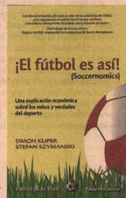
Título: ¡Así es el fútbol! Autor: Simon Kuper y Stefan Szymanski Páginas: 414 Editorial: Empresa Activa

La industria del deporte, y en concreto el fútbol, es un estupendo ejemplo de una gran organización que cada año atrae a muchos profesionales altamente cualificados de distintos ámbitos empresariales. ¡El fútbol es así! , del economista Simon Kuper y el periodista deportivo Stefan Szymanski, se adentra en las reglas que rigen este sector. Destaca el capítulo dedicado a los fichajes. Los autores han elaborado una lista con los doce secretos del mercado de traspasos.