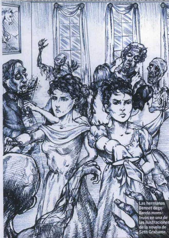
Las hermanas Bennet degollando monstruos en una de las ilustraciones de la novela de Seth Grahame.