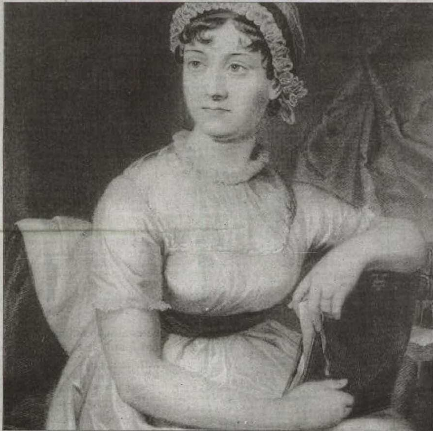
►► La escritora inglesa Jane Austen.

PRÓXIMA PUBLICACIÓN EN ESPAÑA / El libro no existe todavía en versión española -aunque está prevista su publicación a cargo de la editorial Umbriel-, pero el fenómeno parece ya imparable. La misma editorial Quirk ha anunciado para septiembre otra adaptación de Jane Austen: Sentido y sensibilidad y monstruos marinos , en la que langostas gigantes y otros monstruos amenazan los