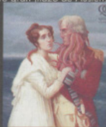
SENSE AND SENSIBILITY AND SEA MONSTERS