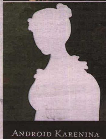
Las letras clásicas, con sangre entran. Arriba, 'Lazarillo: matar zombies nunca fue pan comido' (DeBolsillo) y 'Orgullo y prejuicio y zombies' (Umbriel). Abajo, portada provisional de 'Android Karenina' y 'Sense and Sensibility and Sea Monsters' (Quirk).

Black Album , de Jay-Z, o los tráilers de YouTube en los que, por ejemplo, El resplandor se transforma en una comedia romántica.