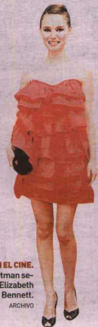
EN EL CINE. Portman será Elizabeth Bennett.

El éxito de la fórmula generó un torrente de mash-ups literarios en Estados Unidos, del que no se libraron ni Mark Twain ( Las aventuras de Huckelberry Finn y Zombie Jim ), ni H.G. Wells ( La guerra de los mundos con sangre, vísceras y zombies ). En Jane bites back , de Michael Thomas Ford, la propia Jane Austen es una solterona de 233 años que se toma su sangrienta venganza contra los que viven de su legado.